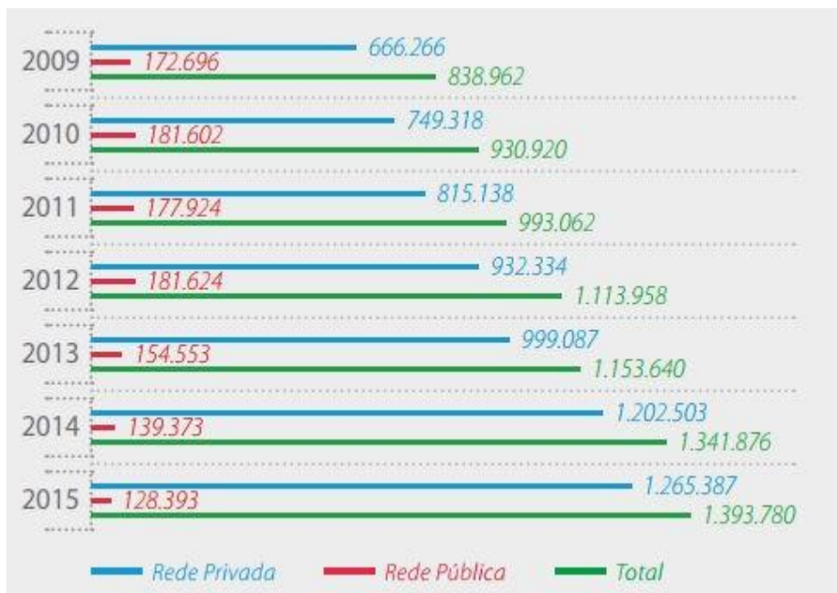
Figura 4. Número de matrículas em cursos de graduação na modalidade a distância (2009 a 2015)